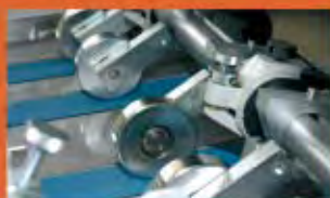
RELIURE BROCHURE DORURE